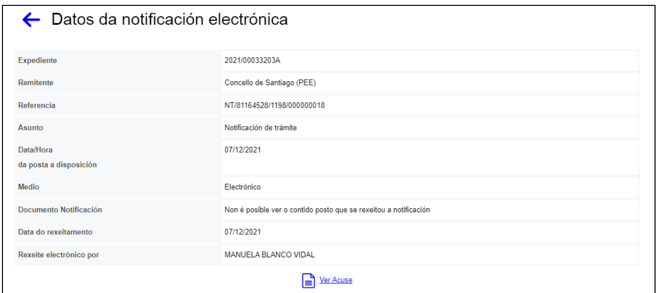
Figura 7. Detalle da notificación asinada e rexeitada

Tamén se entenderá rexeitada cando a notificación por medios electrónicos teña de carácter obrigatorio ou fose elixida expresamente pola persoa interesada e transcorresen 10 días naturais desde a súa posta a disposición sen que acceda ao contido (art. 43.2).