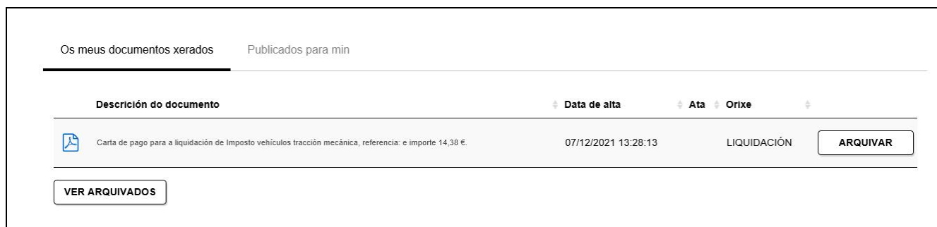
Figura 1. Listaxe de documentos xerados

Pódense activar de novo os documentos arquivados premendo o botón ACTIVAR. Tamén se poden volver consultar os documentos xerados coa opción “Non mostrar arquivados” (ver figura 2 )