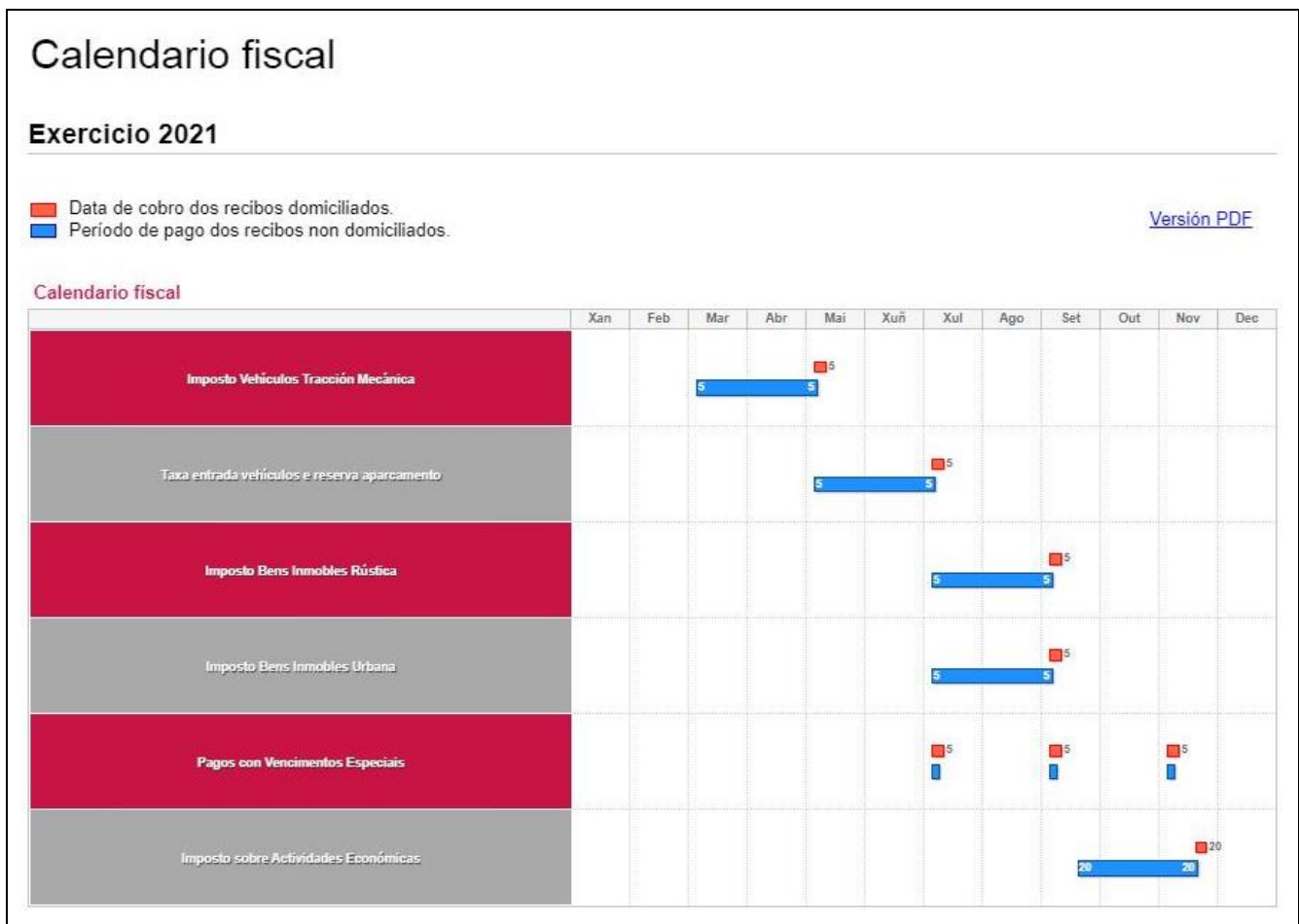
Figura 2. Detalle do calendario fiscal xeral

Tamén pode consultar o calendario fiscal dos obxectos tributarios do Concello (ver figura 2 ).